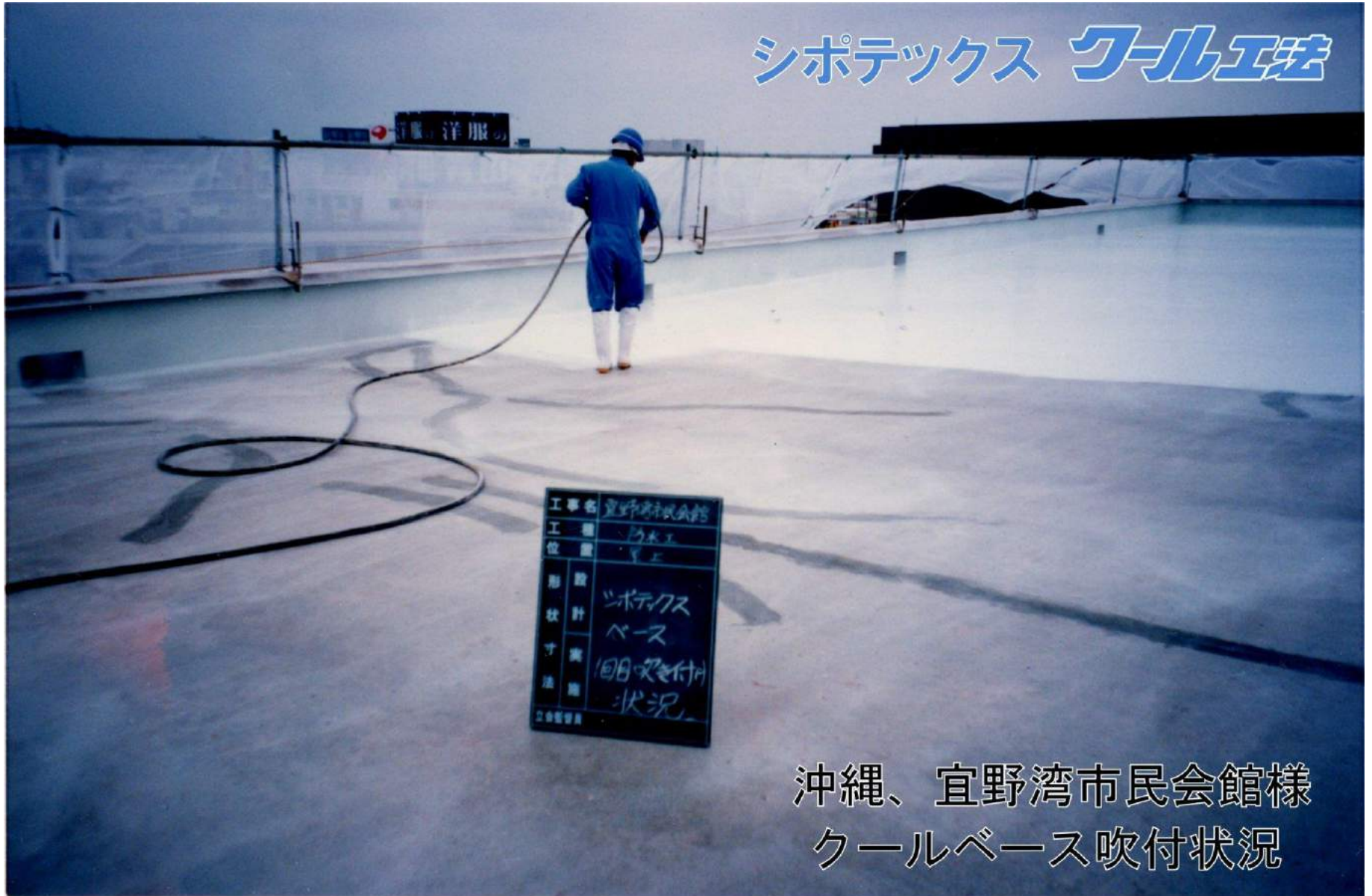
沖縄、宜野湾市民会館様 クールベース吹付状況